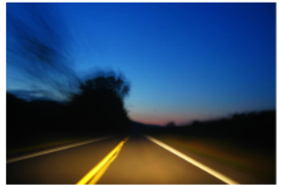
Una aproximación a la sostenibilidad desde las entidades financieras

La versión en español se puede descargar en www.cajasdeahorros.es o solicitarlo en rsc@ceca.es